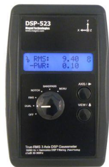
נתוני מכשיר DSP 523:

מכשיר מדויק בעל רגישות גבוהה המשתמש במעבד אותות דיגיטלי חזק. מודד בשלושה צירים את גודל וקטור השדה המגנטי (True RMS). בעל יכולת להבדיל בין שדה מגנטי שמקורו מרשת החשמל (50 Hz והרמוניות שלו) לבין שדה מגנטי שמגיע ממקורות אחרים.